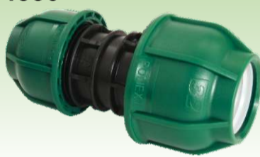
Reducir spojnica PN10