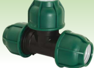
"T" spojnica PN10