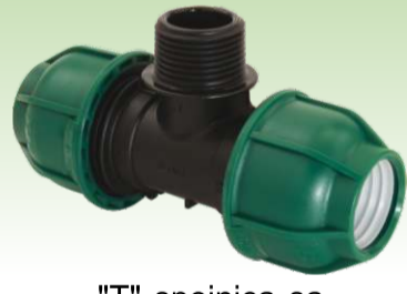
"T" spojnica sa vanjskim navojem PN10