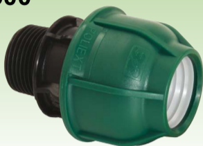
Spojnica sa vanjskim navojem PN10