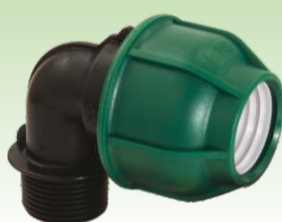
Lakat spojnica sa vanjskim navojem PN10