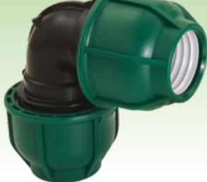
Lakat spojnica PN10