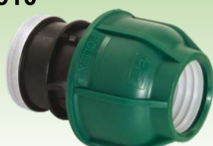
Spojnica sa unutrašnjim navojem PN10