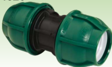
Egal spojnica PN10