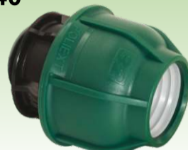
Završni element PN10