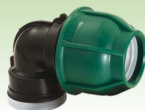
Lakat spojnica sa unutrašnjim navojem PN10