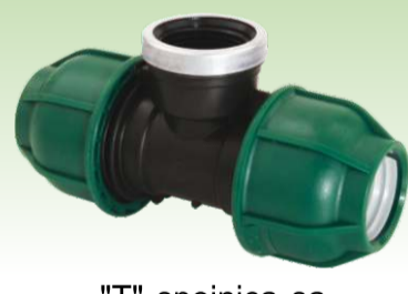
"T" spojnica sa unutrašnjim navojem PN10